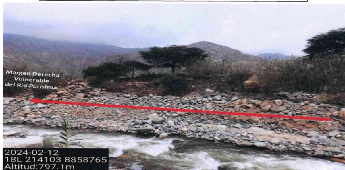
FIGURA N°02: EN LA TEMPORADA DE MAXIMAS AVENIDAS EL RÍO PURISIMA ES VULNERABLE EN LA MARGEN DERECHA DEL TRAMO VERIFICADO EN EL SECTOR CHASQUITAMBO AGUAS ARRIBA DEL CENTRO POBLADO