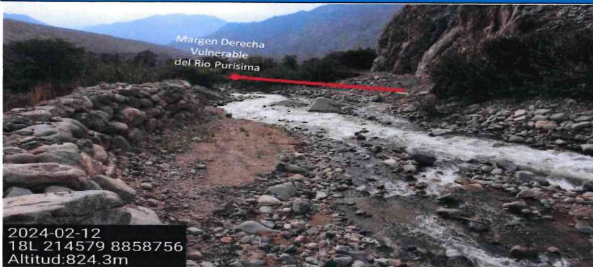
FIGURA N°01: TRAMO CRÍTICO EN EL RÍO PURISIMA , EN EL CHASQUITAMBO, DISTRITO DE COLQUIOC, PROVINCIA DE BOLOGNESI, ANCASH.